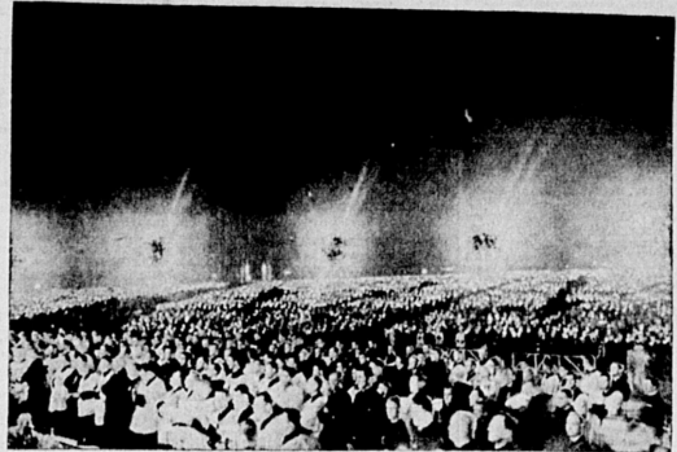
Une foule d'au moins cent mille personnes avait envahi les Plaines d'Abraham, hier soir, pour assister à l'heure d'adoration et à la messe de minuit. Cette photo donne une idée de la multitude et du spectacle incomparable du plus éclatant triomphe que Québec ait jamais fait au Dieu de l'Eucharistie.